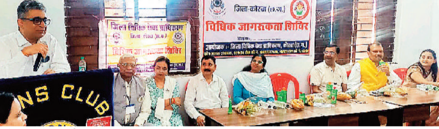
कार्यक्रम को संबोधित करते न्यायाधीश।