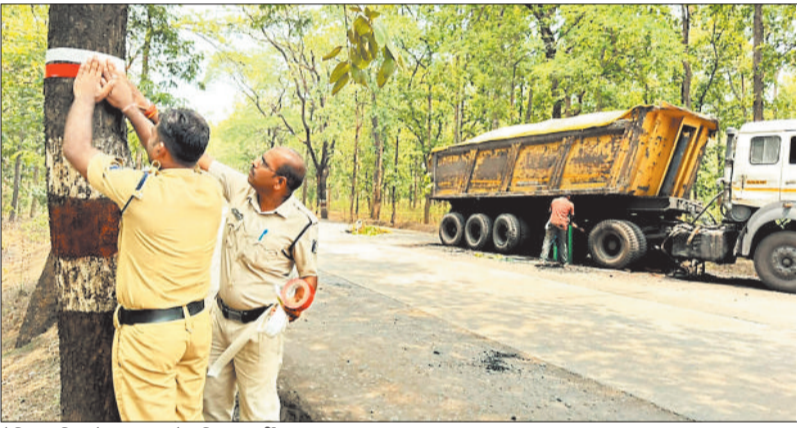
रेडियम रिफ्लेक्टर लगाते पुलिस कर्मी।