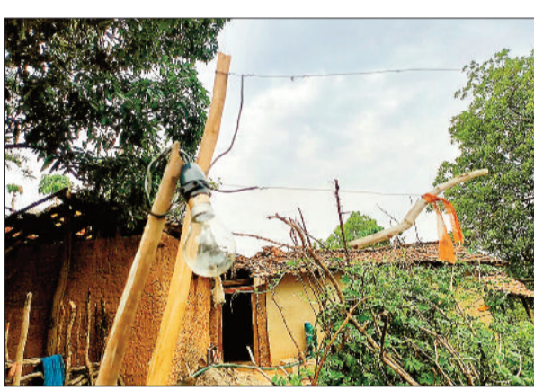
ग्रामीणों द्वारा इस तरह घर के बाहर लगाया गया करंट का जाल।