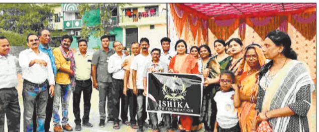
भारी वाहनों की वजह से मार्ग में लगा जाम।

हरिभूमि न्यूज ►► हरदीबाजार सराईसिंगर बलौदा मुख्यमार्ग पर खनिज बेरियर है ठीक उसके सामने पेट्रोल पंप, दीपका-गेवारा कोयला खदान से कोयला लोड लेकर टेलर चालक एक लाईन से भारी वाहन खड़ी कर टोकन कटवाकर आगे बढ़ते हैं, लेकिन सामने से आती खाली भारी वाहन उसके साथ ही खनिज बेरियर के ठीक सामने पेट्रोल पंप भी है। जहां वाहन चालक डीजल व पेट्रोल के लिए पहुंचते हैं। उन्हें भी जाम की वजह से उन्हें भी काफी परेशान होना पड़ता है।