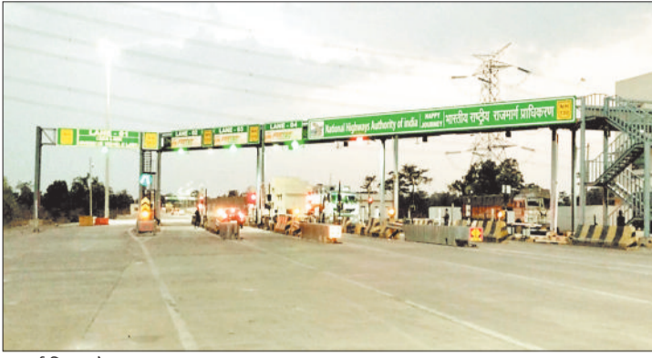
सुतरा स्थित टोल प्लाजा।

भारत सरकार के भूतल परिवहन मंत्रालय के अंतर्गत राष्ट्रीय राजमार्ग प्राधिकरण सड़कों के विकास और यातायात को सुगम करने का काम कर रहा है। कोरबा जिले में हजारों करोड़ की लागत से तैयार किये गए नेशनल हाईवे-130बी पर आवाजाही जारी है। इसका दूसरा सिरा अंबिकापुर की तरफ शिवपुर के आगे से बचा हुआ है। कोरबा जिले में दो स्थान पर लगाए गए टोल बेरियर के कारण आए दिन विवाद की स्थिति निर्मित हो रही है। सबसे बड़ा कारण टोल बेरियर के पास की आबादी से वसूली करना है।