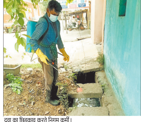
दवा का छिड़काव करते निगम कर्मी।

जल जनित व कीटनाशक बीमारियों से बचाव के लिए अधिकारियों को दिए निर्देश