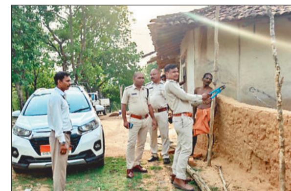
घर के बाहर लगे करंट तार को काटता वन अमला।

का झुण्ड पहुंच गया था और हाथियों से निपटने के लिए ग्रामीणों ने अपने-अपने घरों के चारों तरफ करंट प्रवाहित तार की जाल बिछा दी थी। जब इसकी भनक प्रशासन को लगी तो प्रशासन व पुलिस और वन विभाग की टीम मौके पर पहुंची