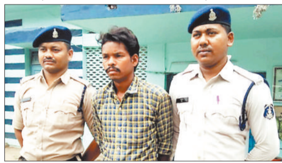
पुलिस गिरफ्तार में आरोपी।